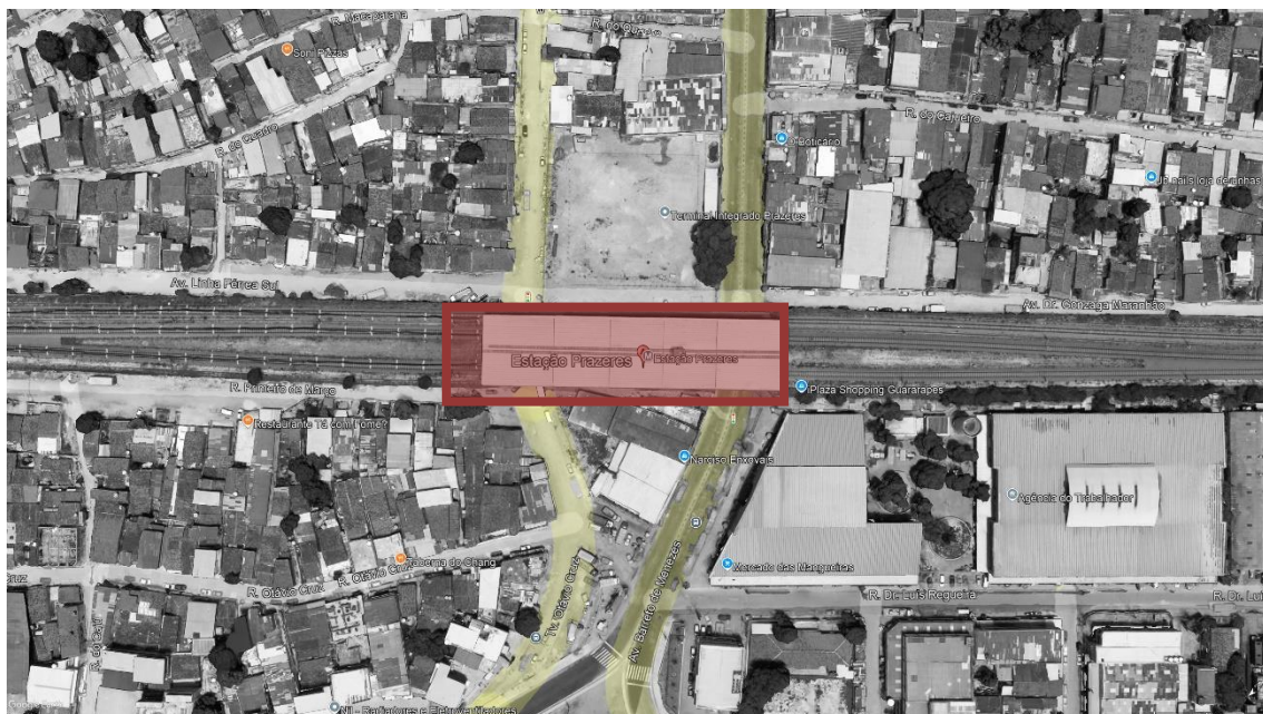
FIGURA 1 – ESTAÇÃO PRAZERES (Fonte: Google Earth 2024)